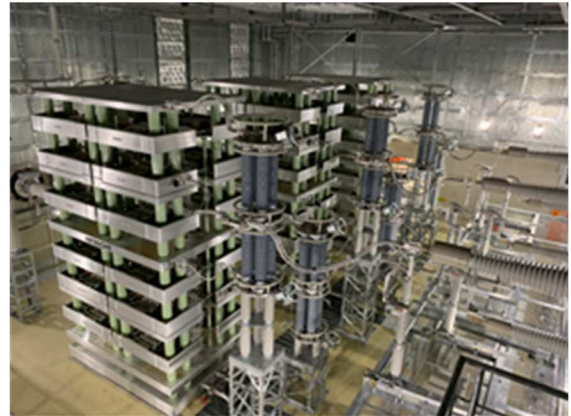
飛騨変換所：サイリスタバルブ